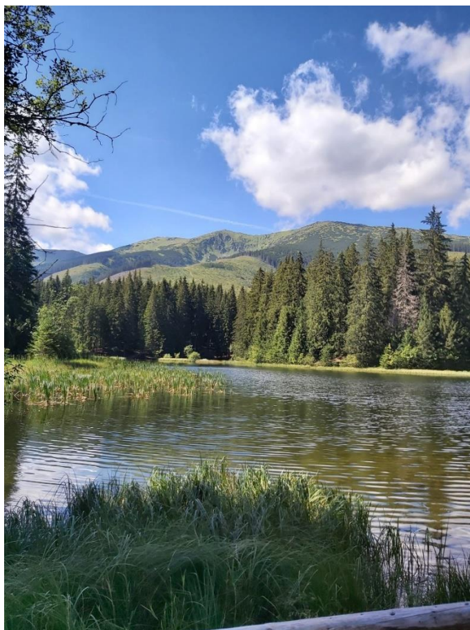
- prechádzka okolo Verbického plesa –