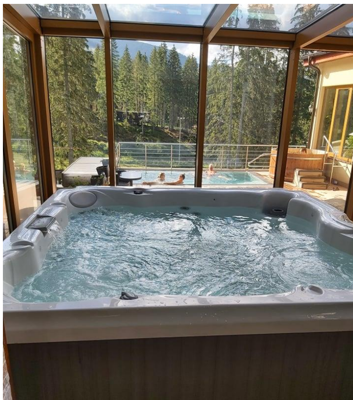
- hotelový wellness -