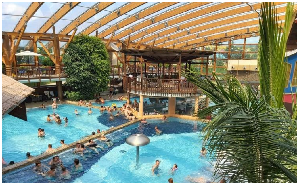
- cestou zastávka v Tatralandii -